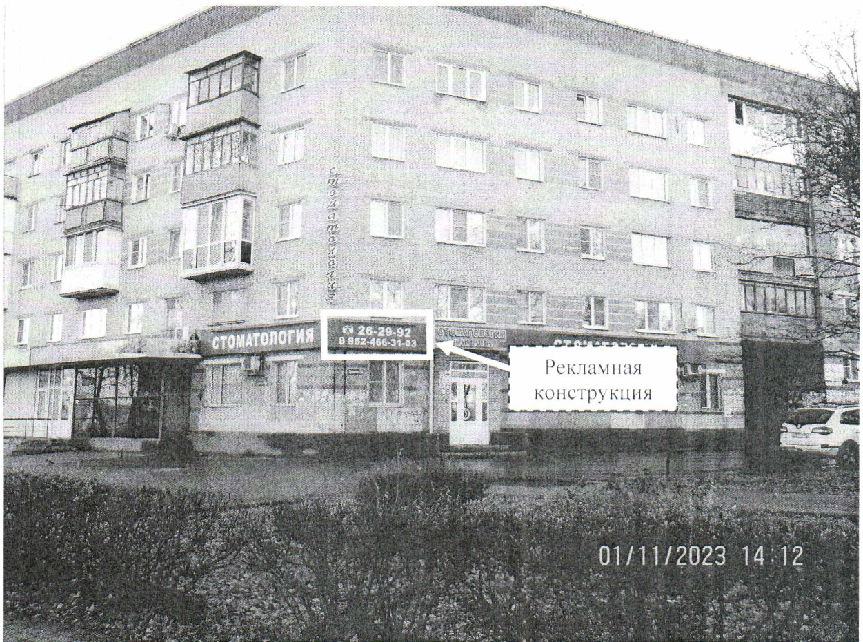
Фото № 1: Панорамный вид размещения рекламной конструкции

Фотофиксация рекламной конструкции размером 2,5 х 0,5 м с эскизным изображением «26-29-92 8 952-466-31-03», расположенной по адресу: г. Дзержинск, ул. Урицкого, д. 4.