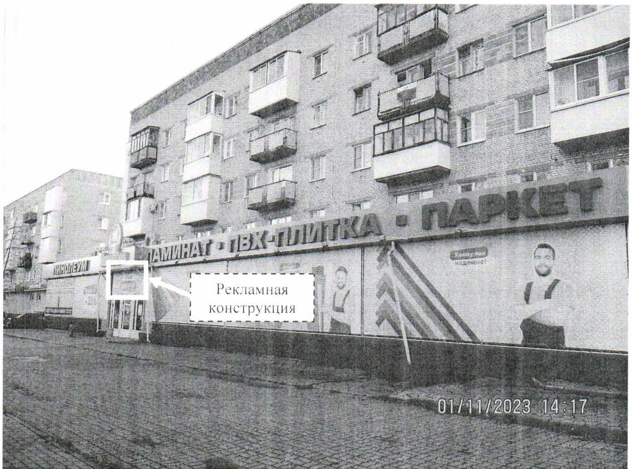
Фото № 1: Панорамный вид размещения рекламной конструкции

Фотофиксация рекламной конструкции размером 3,5 x 1,5 м с эскизным изображением «У нас дешевле», расположенной по адресу: г. Дзержинск, ул. Урицкого, д. 4.