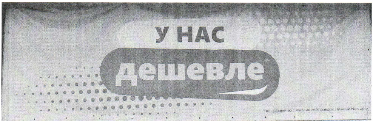
Фото № 2: Эскизное изображение рекламной конструкции