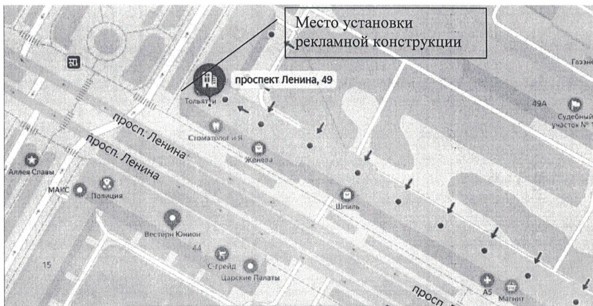
Схема установки (размещения) рекламной конструкции с эскизным изображением «Автоматазин Тольятти Запчасти», расположенной по адресу: Нижегородская обл., г. Дзержинск, пр. Ленина, д.49