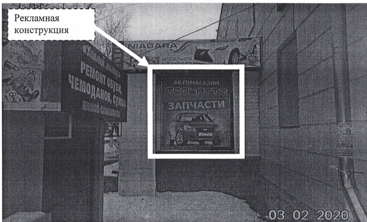
Фото № 1: Панорамный вид размещения рекламной конструкции

Фотофиксация рекламной конструкции с эскизным изображением «Автоматазин Тольятти Запчасти», расположенной по адресу: Нижегородская обл., г. Дзержинск, пр. Ленина, д.49.