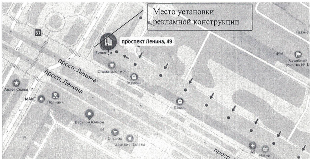
Схема установки (размещения) рекламной конструкции с эскизным изображением «Автозапчасти ВАЗ, НИВА, CHEVY NIVA.Кредит. Рассрочка.АКБ. Аксессуары.», расположенной по адресу: Нижегородская обл., г. Дзержинск, пр. Ленина, д.49