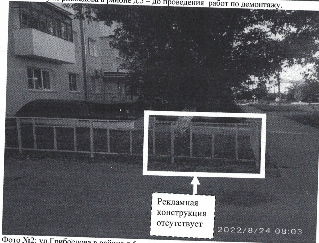
Фото №2: ул.Грибоедова в районе д.5 – после проведения работ по демонтажу.