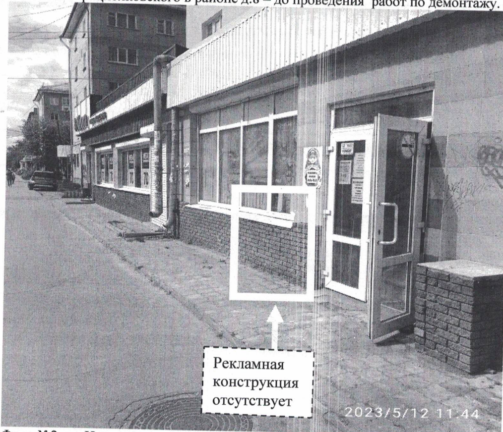
Фото №2: пр.Циолковского в районе д.8 – после проведения работ по демонтажу.