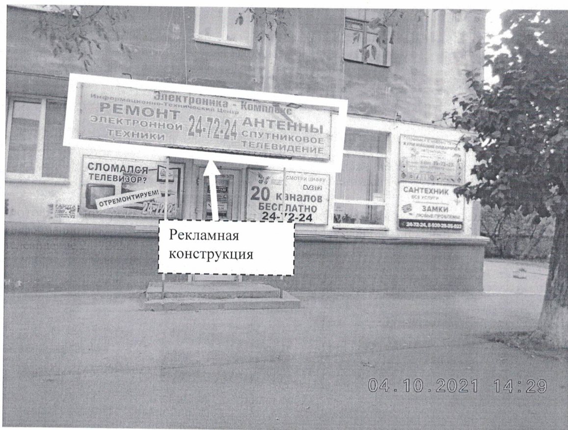
Фото № 1: Панорамный вид размещения рекламной конструкции

Фотофиксация рекламной конструкции с эскизным изображением Электроника-Комплекс Информационно Технический Центр Ремонт электронной техники Антенны спутниковое телевидение 24-72-24