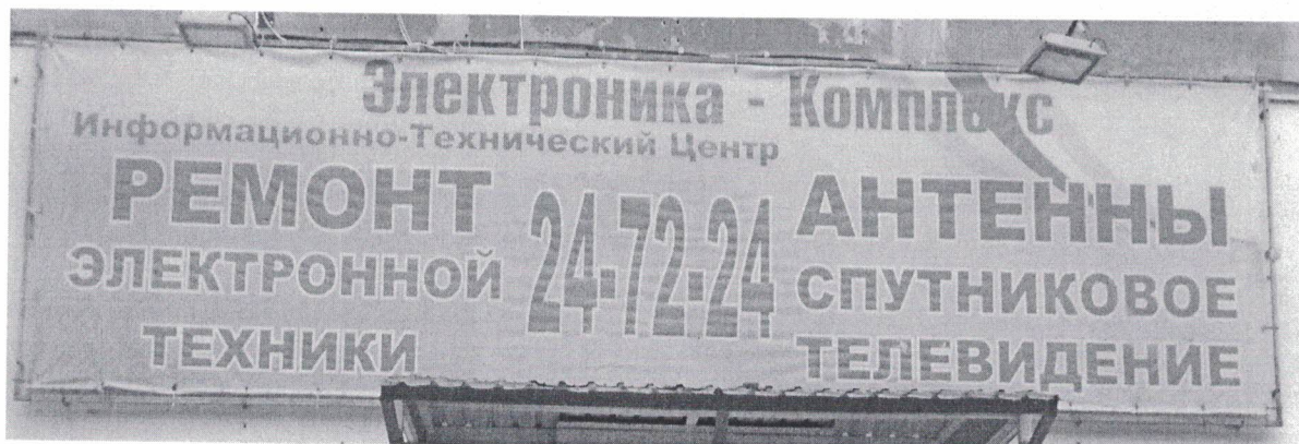
Фото № 2: Эскизное изображение рекламной конструкции