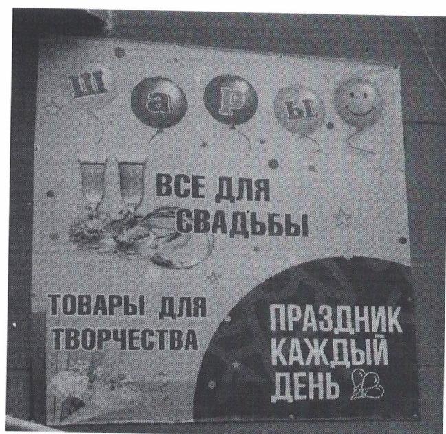
Фото № 2: Эскизное изображение рекламной конструкции