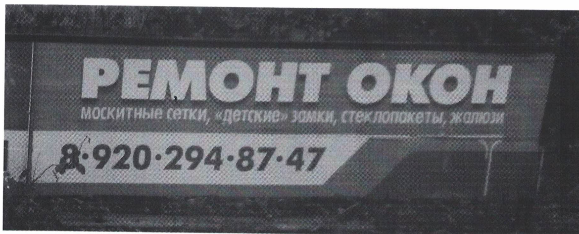
Фото № 2: Эскизное изображение рекламной конструкции