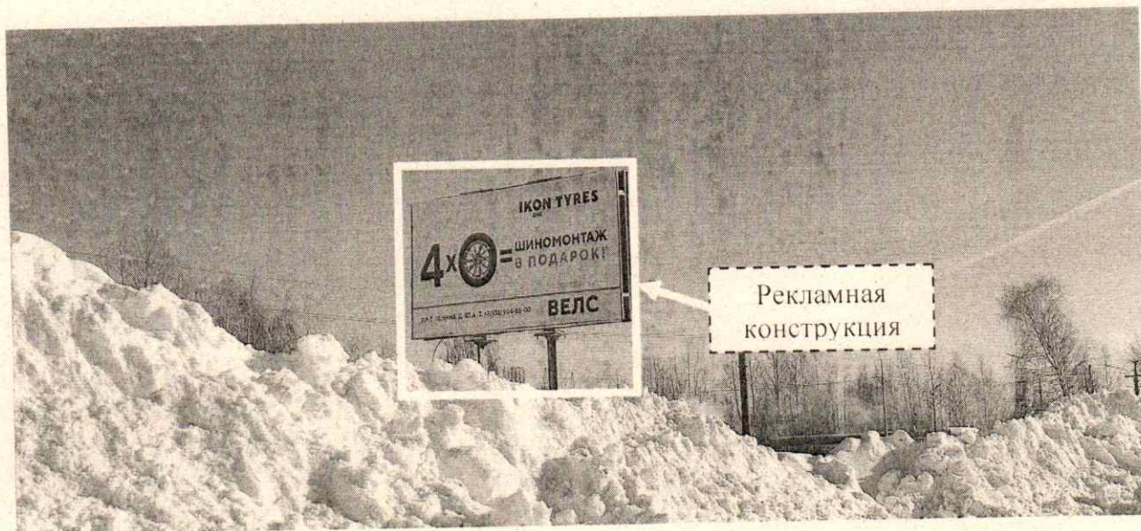
Фото № 1: Панорамный вид размещения рекламной конструкции (сторона А)

Фотофиксация рекламной конструкции размером 6,0 x 3,0 м с эскизным изображением на стороне А: «IKON TYRES ШИНОМОНТАЖ В ПОДАРОК! пр-т Ленина, д. 121А т. +7(951)904-55-00 ВЕЛС», на стороне Б: «Viatti www.viatti.ru 8-800-100-12-72 ШИНЫ ДЛЯ НАШЕЙ ЗИМЫ интернет магазин WWW.VWLS52.RU ПРОГРАММА «365» ШИНОМОНТАЖ В ПОДАРОК ВЕЛС +7(951)904-55-00», расположенной по адресу: г. Дзержинск, пр. Ленина, в районе д. 121А.