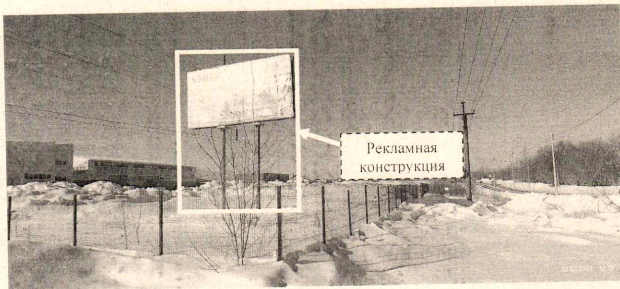
Фото № 2: Панорамный вид размещения рекламной конструкции (сторона Б)