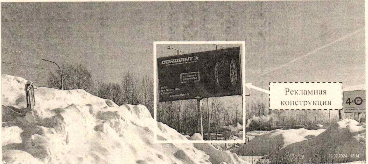
Фото № 1: Панорамный вид размещения рекламной конструкции (сторона А)

Фотофиксация рекламной конструкции размером 6,0 х 3,0 м с эскизным изображением на стороне А: «CORDIANT врожденное сцепление с дорогой БЕСПЛАТНЫЙ ШИНОМОНТАЖ ВЕЛС пр-т Ленина, 121А т. 23-55-00 www.coldiant.ru», на стороне Б: «ВОЗРОЖДЕНИЕ ЛЕГЕНДЫ IKON TYRES новое имя знакомых машин пр-т Ленина, д. 121А т. +7(951)904-55-00 ВЕЛС», расположенной по адресу: г. Дзержинск, пр. Ленина, в районе д. 121А.