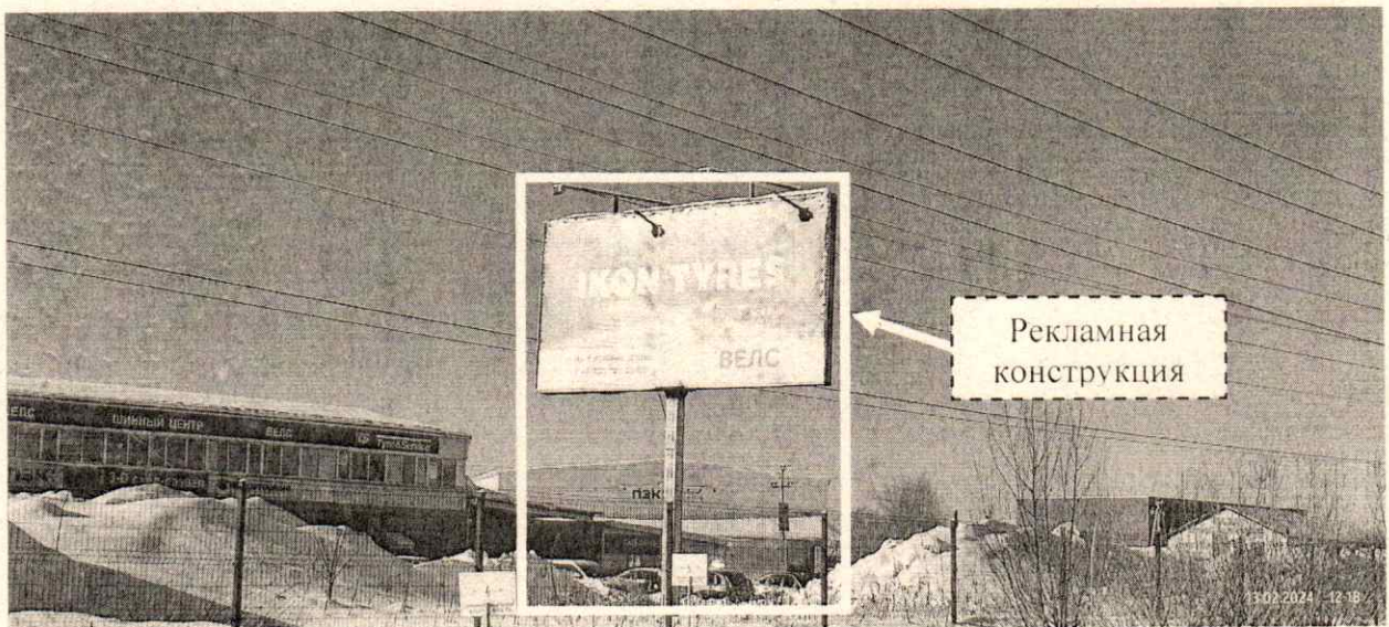
Фото № 2: Панорамный вид размещения рекламной конструкции (сторона Б)