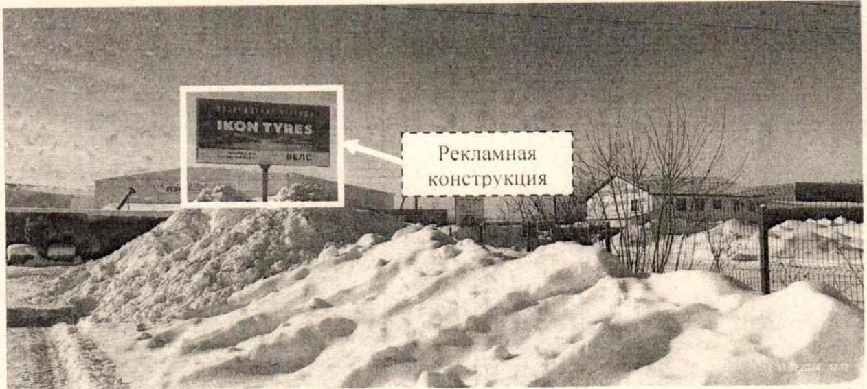
Фото № 1: Панорамный вид размещения рекламной конструкции (сторона А)

Фотофиксация рекламной конструкции размером 6,0 х 3,0 м с эскизным изображением на стороне А: «IKON TYRES ШИНОМОНТАЖ В ПОДАРОК! пр-т Ленина, д. 121А т. +7(951)904-55-00 ВЕЛС», на стороне Б: «IKON TYRES ШИНОМОНТАЖ В ПОДАРОК! пр-т Ленина, д. 121А т. +7(951)904-55-00 ВЕЛС», расположенной по адресу: г. Дзержинск, пр. Ленина, в районе д. 121А.