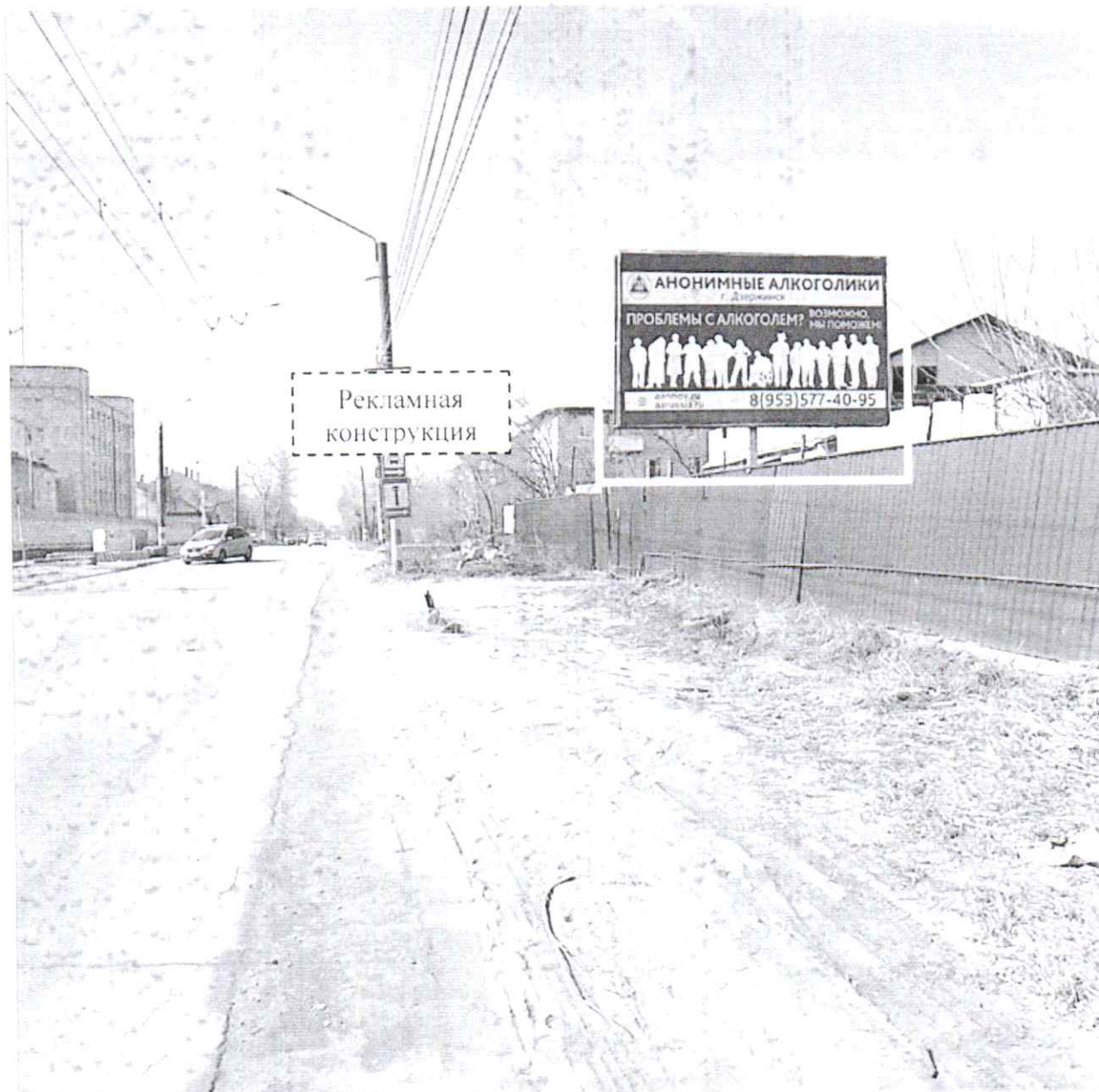
Фото № 1: Панорамный вид размещения рекламной конструкции (сторона А)

Фотофиксация рекламной конструкции размером 6,0 x 3,0 м с эскизным изображением на стороне А: «АНОНИМНЫЕ АЛКОГОЛИКИ г. Дзержинск ПРОБЛЕМЫ С АЛКОГОЛЕМ? ВОЗМОЖНО, МЫ ПОМОЖЕМ! aannov.ru aarussia.ru 8(953)577-40-95». на стороне Б: «8 910 137 85 84», расположенной по адресу: г. Дзержинск, ул. Студенческая, напротив д. 39.