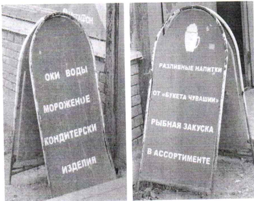
Фото № 2: Эскизное изображение рекламной конструкции (стороны А и Б)