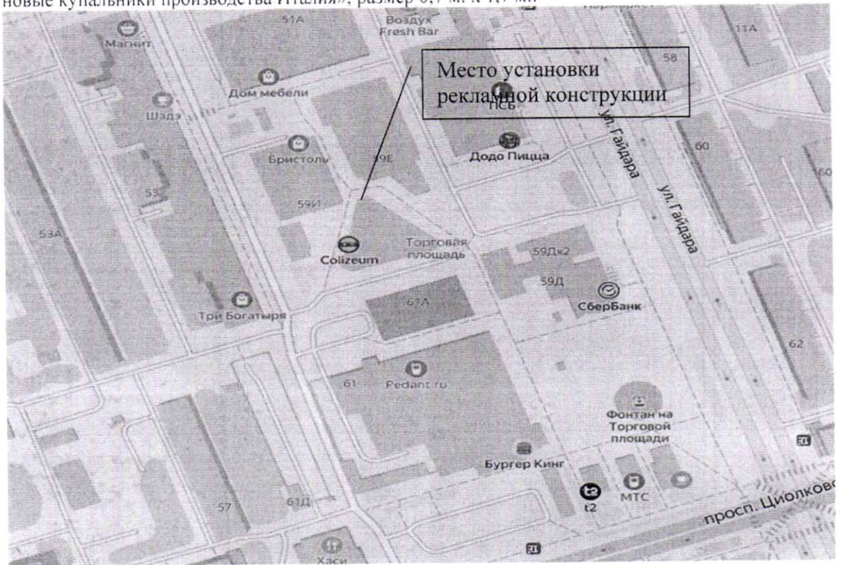
Схема установки (размещения) рекламной конструкции с эскизным изображением «ФИ-ФИ отдел нижнего БЕЛЬЯ И КУПАЛЬНИКОВ размеры от А до Н всегда в продаже подарочные сертификаты новые купальники производства Италия», размер 0,7 м. х 1,7 м.: