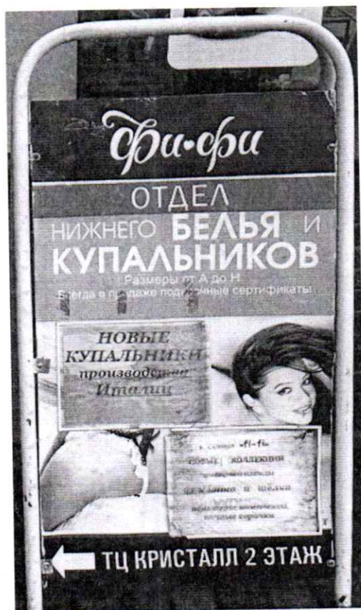
Фото № 2: Эскизное изображение рекламной конструкции