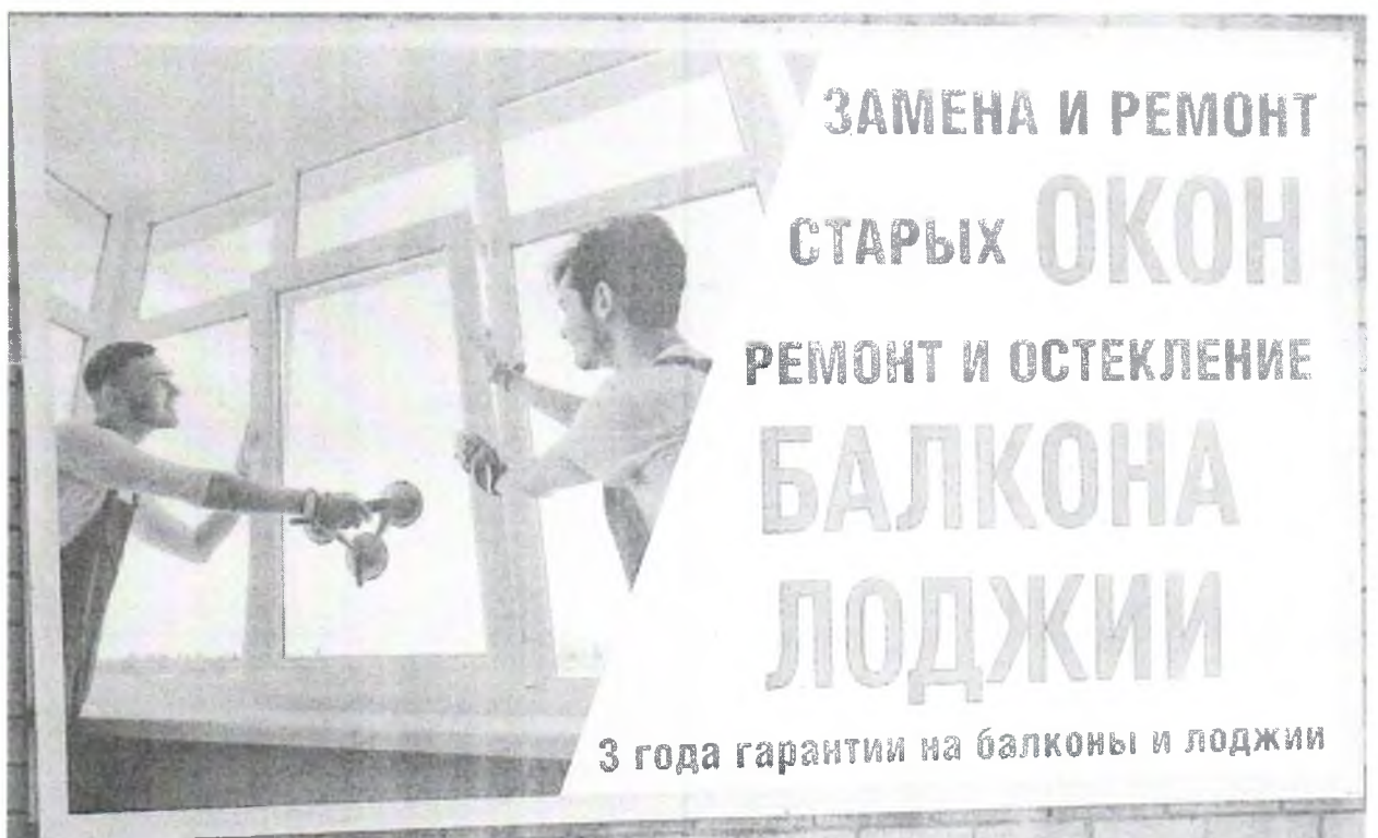
Фото №2: Эскизное изображение рекламной конструкции