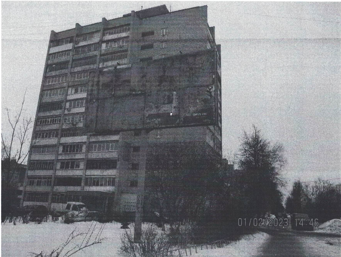
Фото № 3: Панорамное изображение рекламной конструкции, Сторона Б.