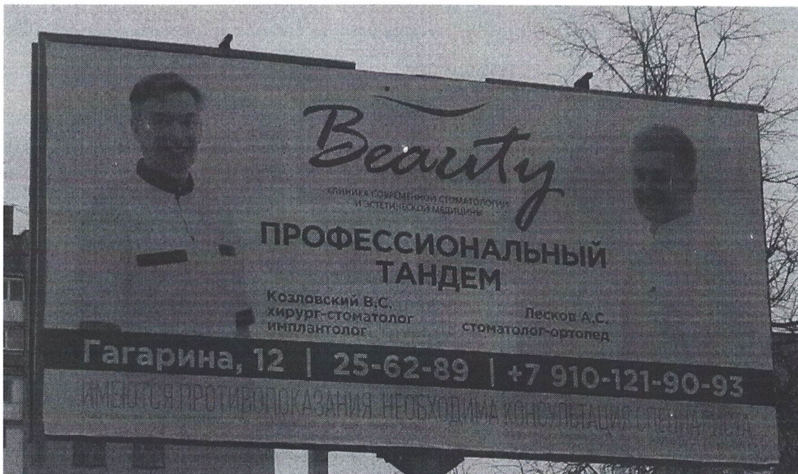
Фото № 2: Эскизное изображение рекламной конструкции, Сторона А.