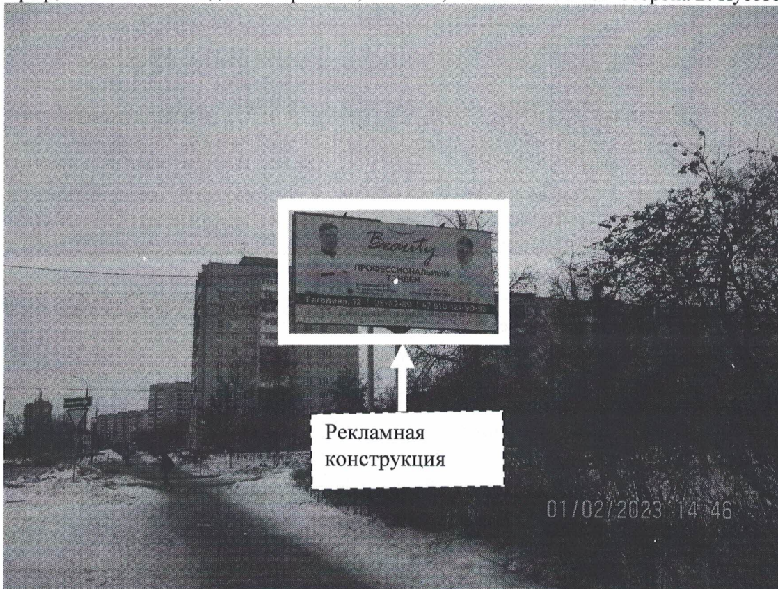
Фото № 1: Панорамное размещение рекламной конструкции, Сторона А.

Фотофиксация места установки (размещения) рекламной конструкции с эскизным изображением «Сторона А: Beauty Клиника современной стоматологии и медицины Профессиональный тандем Гагарина 12, 25-62-89, +7 910-121-90-93. Сторона Б: Пустое поле».