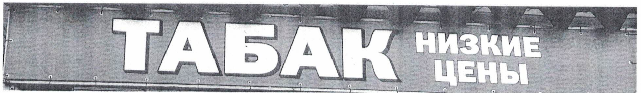
Фото №2: Эскизное изображение рекламной конструкции