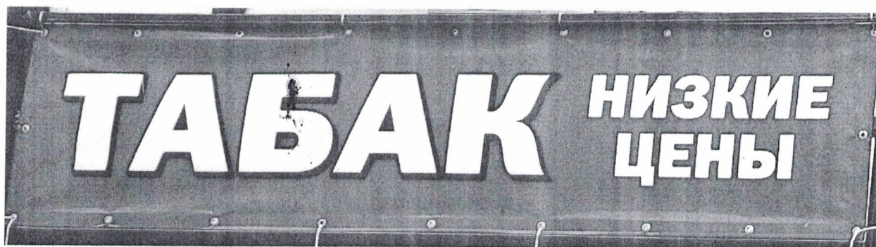
Фото №2: Эскизное изображение рекламной конструкции