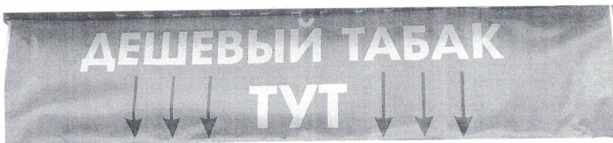
Фото №2: Эскизное изображение рекламной конструкции