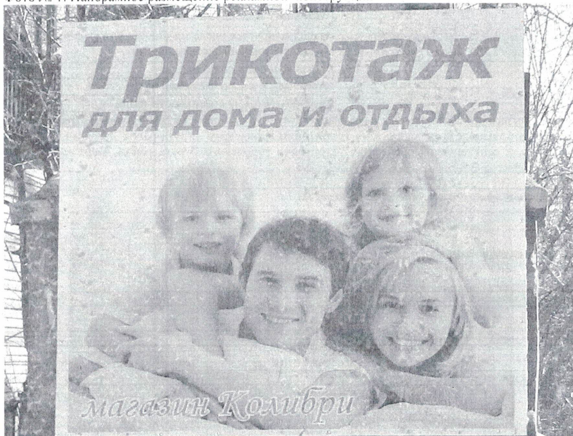
Фото № 2: Эскизное изображение рекламной конструкции