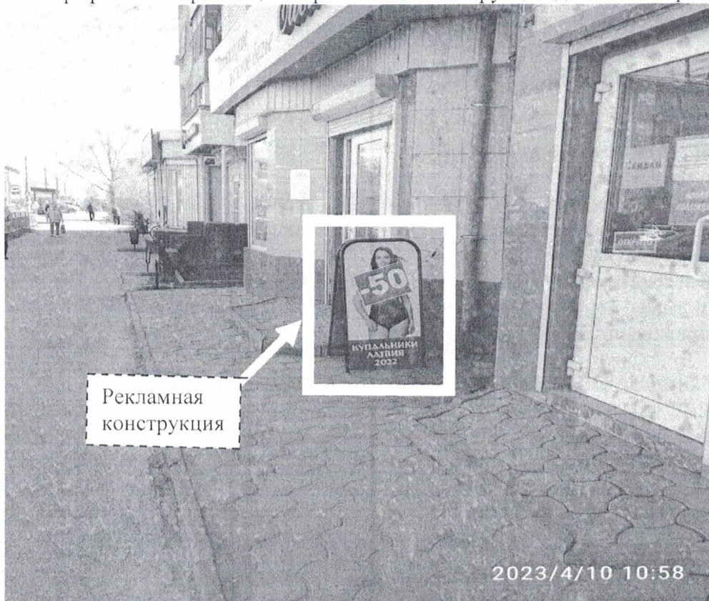
Фото №1: пр.Циолковского в районе д.19 – до проведения работ по демонтажу.

Фотографии места размещения рекламной конструкции до и после проведения работ