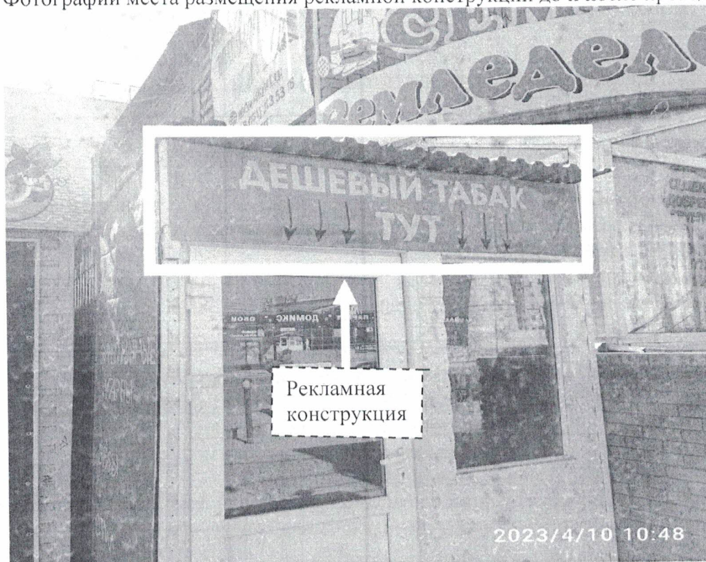
Фото №1: ул.Гайдара в районе д.59В – до проведения работ по демонтажу.

Фотографии места размещения рекламной конструкции до и после проведения работ