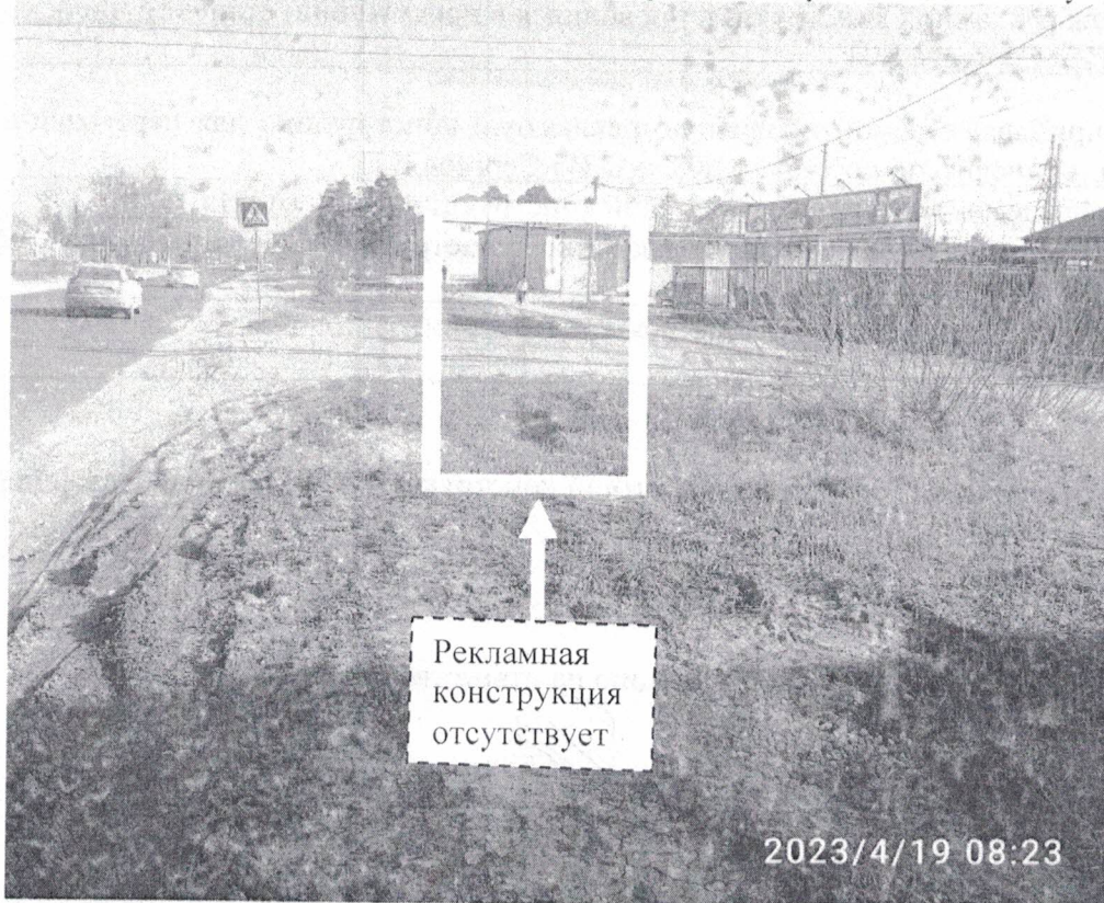
Фото №2: пр.Свердлова в районе д.62д. – после проведения работ по демонтажу.