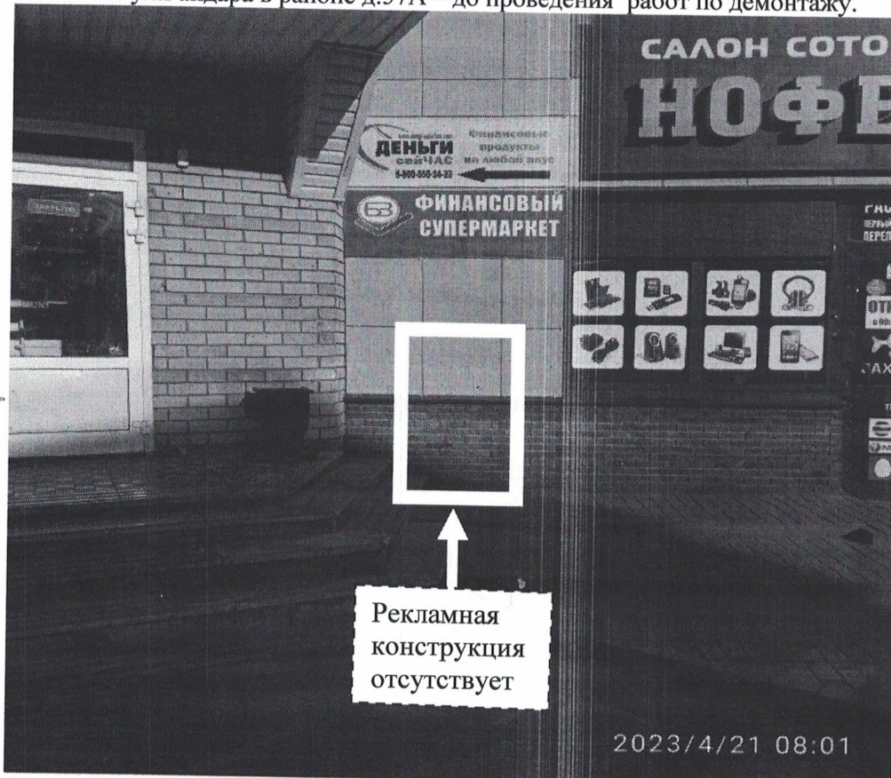
Фото №2: ул.Гайдара в районе д.57А – после проведения работ по демонтажу.