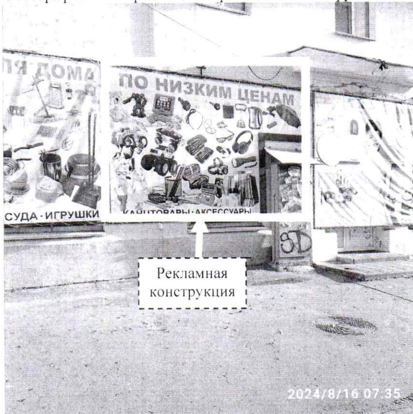
Фото № 1: пр. Ленина, д. 85 – до проведения работ по демонтажу.

Фотографии места размещения рекламной конструкции до и после проведения работ: