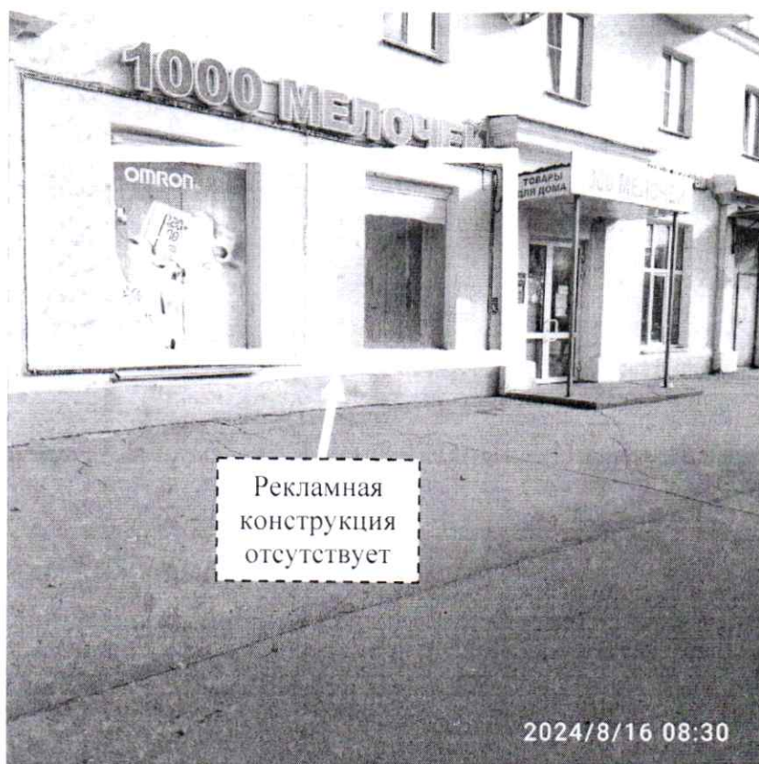
Фото № 2: пр. Ленина, д. 85 – после проведения работ по демонтажу.