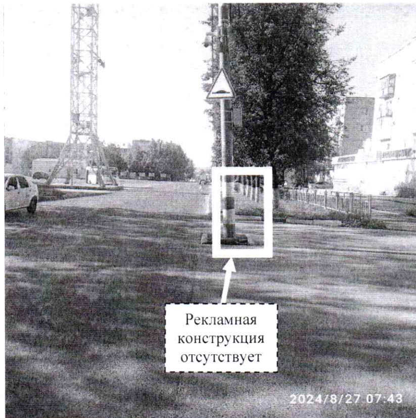
Фото № 2: ул. Урицкого, в районе д. 4 – после проведения работ по демонтажу.