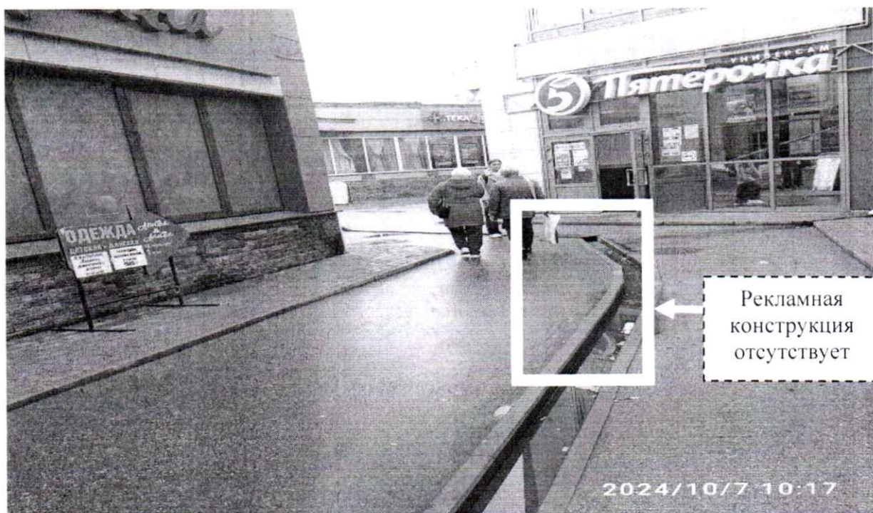
Фото № 2: ул. Гайдара, д. 59Г – после проведения работ по демонтажу.