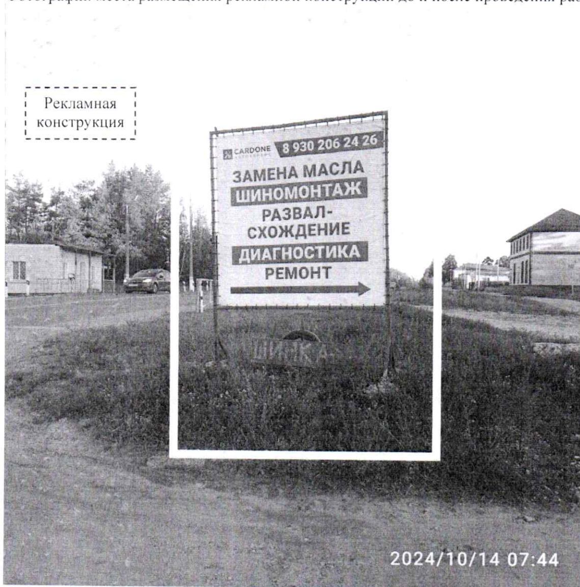
Фото № 1: пр. Свердлова, д. 64 – до проведения работ по демонтажу.

Фотографии места размещения рекламной конструкции до и после проведения работ: