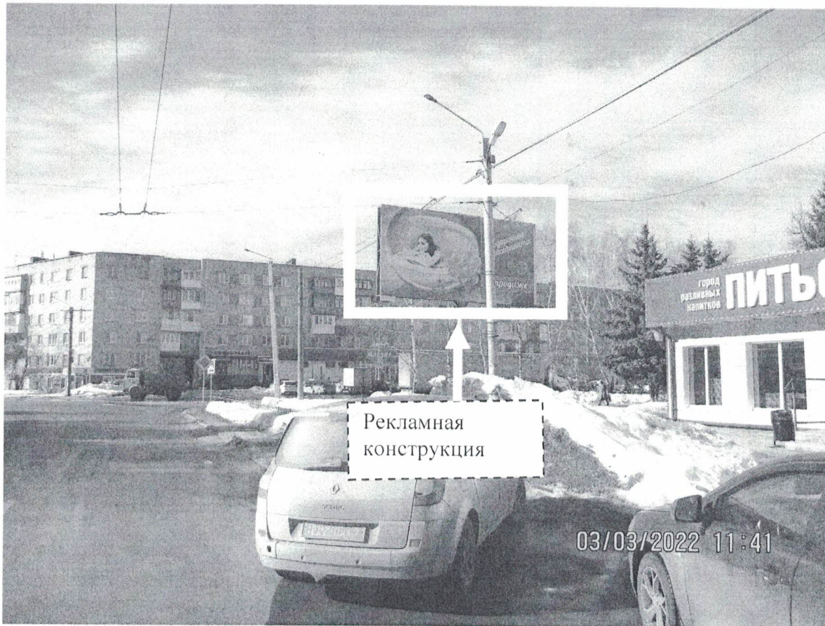
Фото № 1: Панорамное размещение рекламной конструкции.

Фотофиксация места установки (размещения) рекламной конструкции с эскизным изображением «Сторона А: Подарочные сертификаты в продаже Сторона Б: Женский клуб www.luxwellnes.ru Парковая аллея, д.6а +79503750705, (8313)244-144 Кедровая бочка»