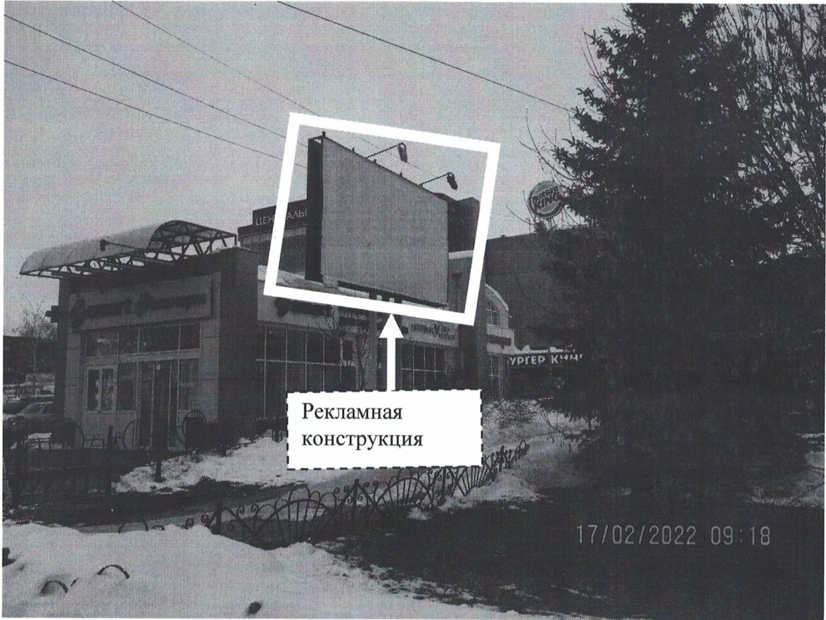
Фото № 1: Панорамное размещение рекламной конструкции Сторона А.

Фотофиксация места установки (размещения) рекламной конструкции с эскизным изображением «Сторона А: Пустое поле Сторона Б: SOS-LIFE.RU -Мамочка, мое скрдечко бьется внутри тебя СОХРАНИ МНЕ ЖИЗНЬ Кризисная линия:8 800 100 48 77 Звоните - поможем!»