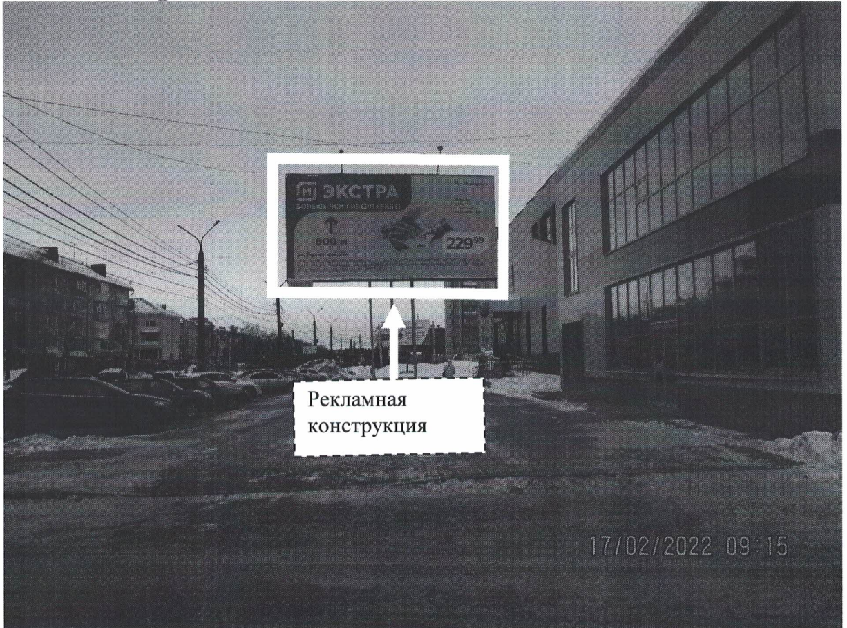
Фото № 1: Панорамное размещение рекламной конструкции, Сторона А.

Фотофиксация места установки (размещения) рекламной конструкции с эскизным изображением «Сторона А: М ЭКСТРА Больше чем гипермаркет 600м, ул.Терешковой, 27А 16- 22 февраля СВИНИНА Лопаточная часть без кости, охлажденная 1кг. 229,99 Сторона Б: СТАТУС-Н Юридическое агентство Восстановим на работе Взыщем заработную плату Консультация от 1000р. 244-400 г.Дзержинск ул.Грибоедова, 20 status-n.ru info@status-n.ru»