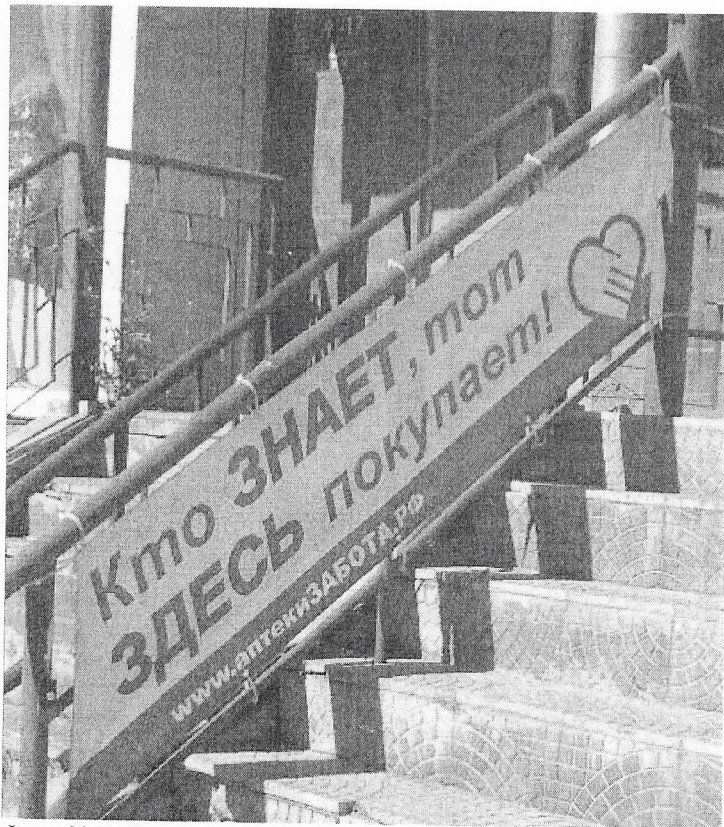
Фото № 2: Эскизное изображение рекламной конструкции