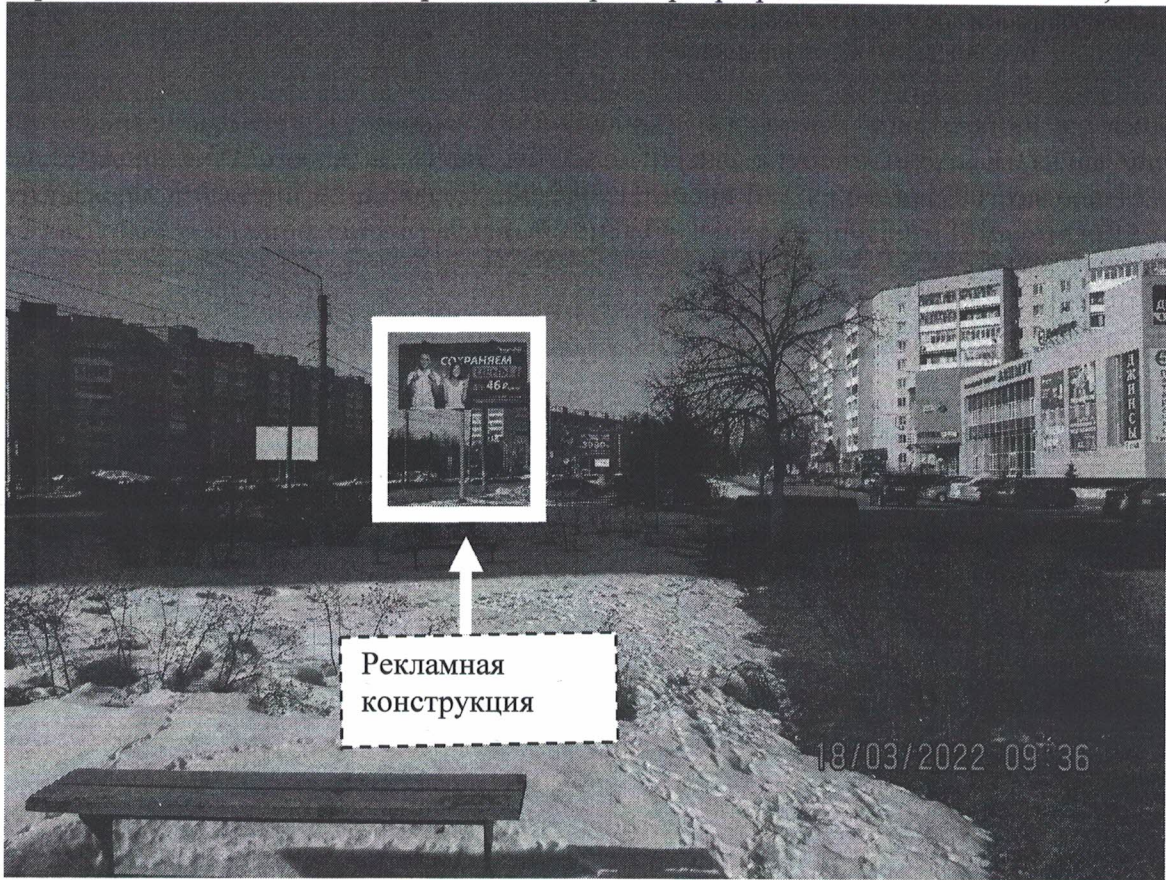
Фото № 1: Панорамное размещение рекламной конструкции.

Фотофиксация места установки (размещения) рекламной конструкции с эскизным изображением «Сторона А: ФизКульт Сеть Фитнес-клубов Сохраняем Цены Фитнес, тренажеры и бассейн 46 р./день 2 200 236 Сторона Б: Скидка на 700 товаров 15% для строительства и обновления Красочный город Ордер пр.Ленинского Комсомола,13»