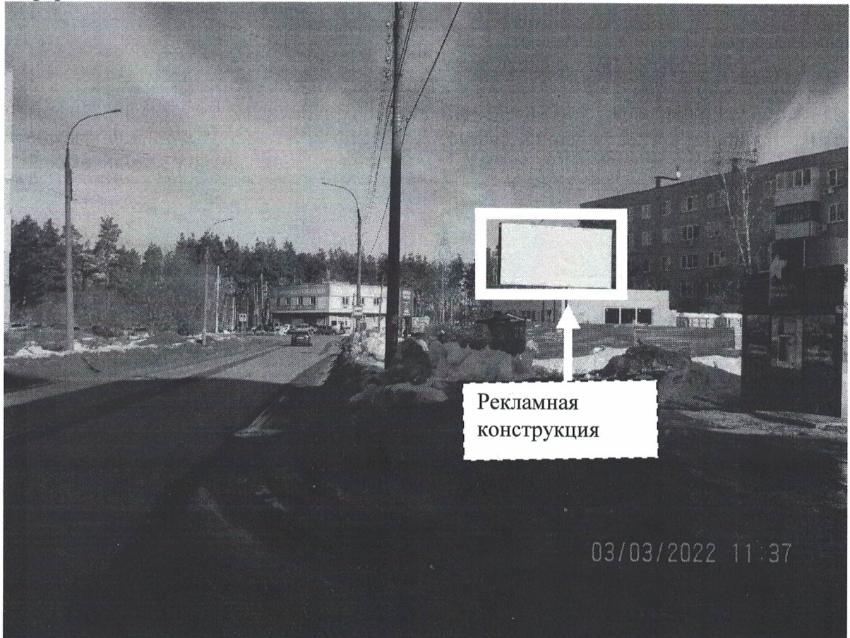
Фото № 1: Панорамное размещение рекламной конструкции.

Фотофиксация места установки (размещения) рекламной конструкции с эскизным изображением «Сторона А: Чистое информационное поле Сторона Б: Чистое информационное поле»