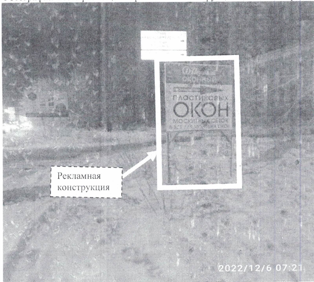
Фото №1: г. Дзержинск, ул.Свердлова в районе д.24– до проведения работ по демонтажу.

Фотографии места размещения рекламной конструкции до и после проведения работ