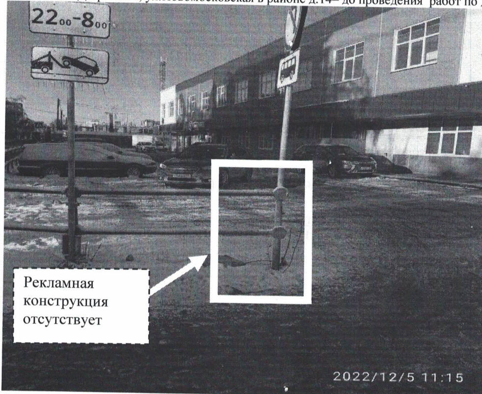
Фото №2: г. Дзержинск, ул.Новомосковская в районе д.14—после проведения работ по демонтажу.