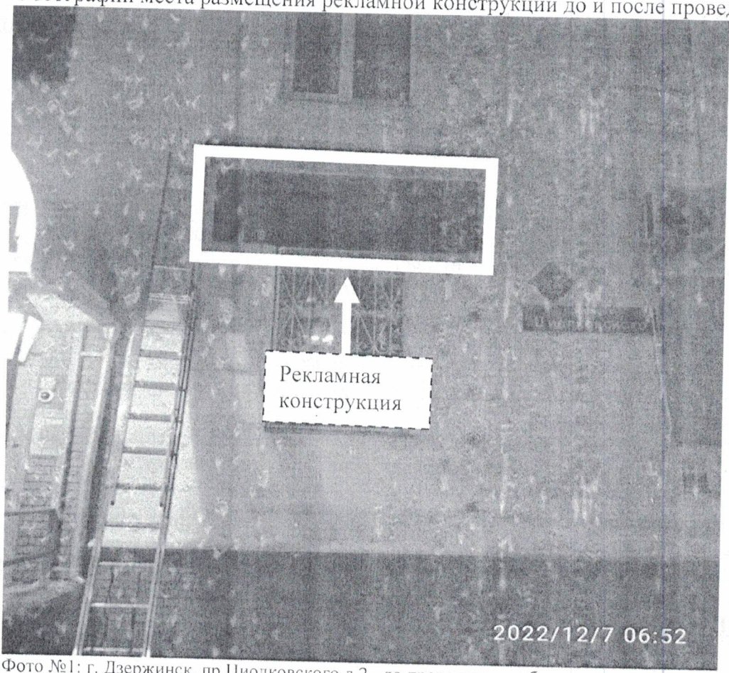
Фото №1: г. Дзержинск, пр.Циолковского д.2– до проведения работ по демонтажу.