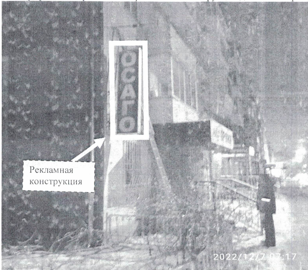
Фото №1: г. Дзержинск, ул.Грибоедова д.23– до проведения работ по демонтажу.

Фотографии места размещения рекламной конструкции до и после проведения работ