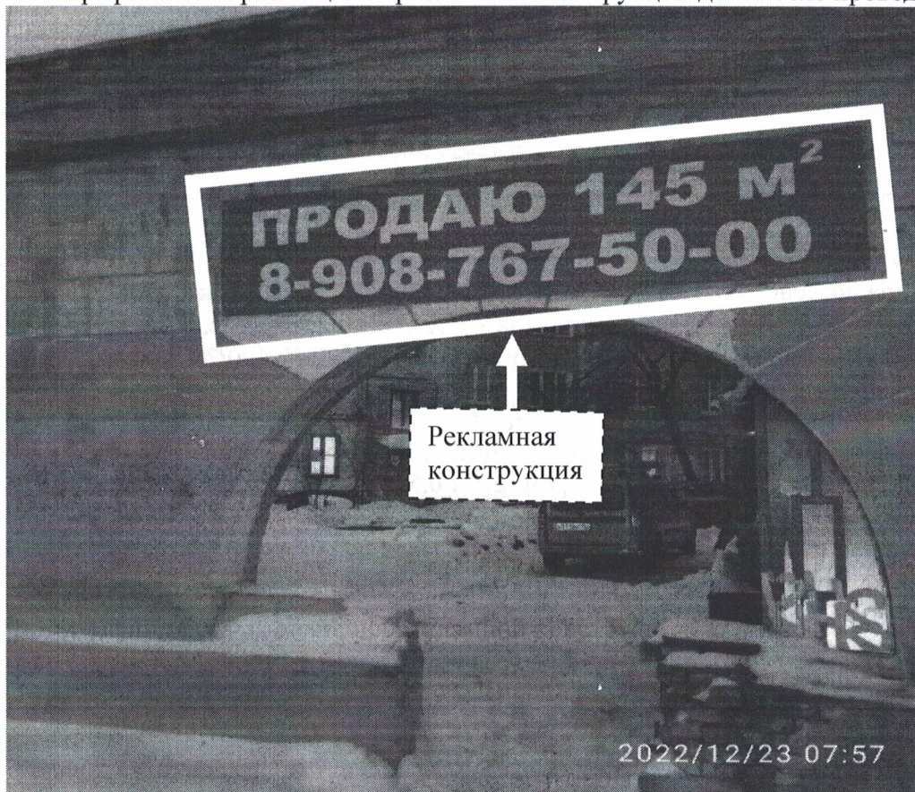
Фото №1: ул.Маяковского д.5 – до проведения работ по демонтажу.

Фотографии места размещения рекламной конструкции до и после проведения работ