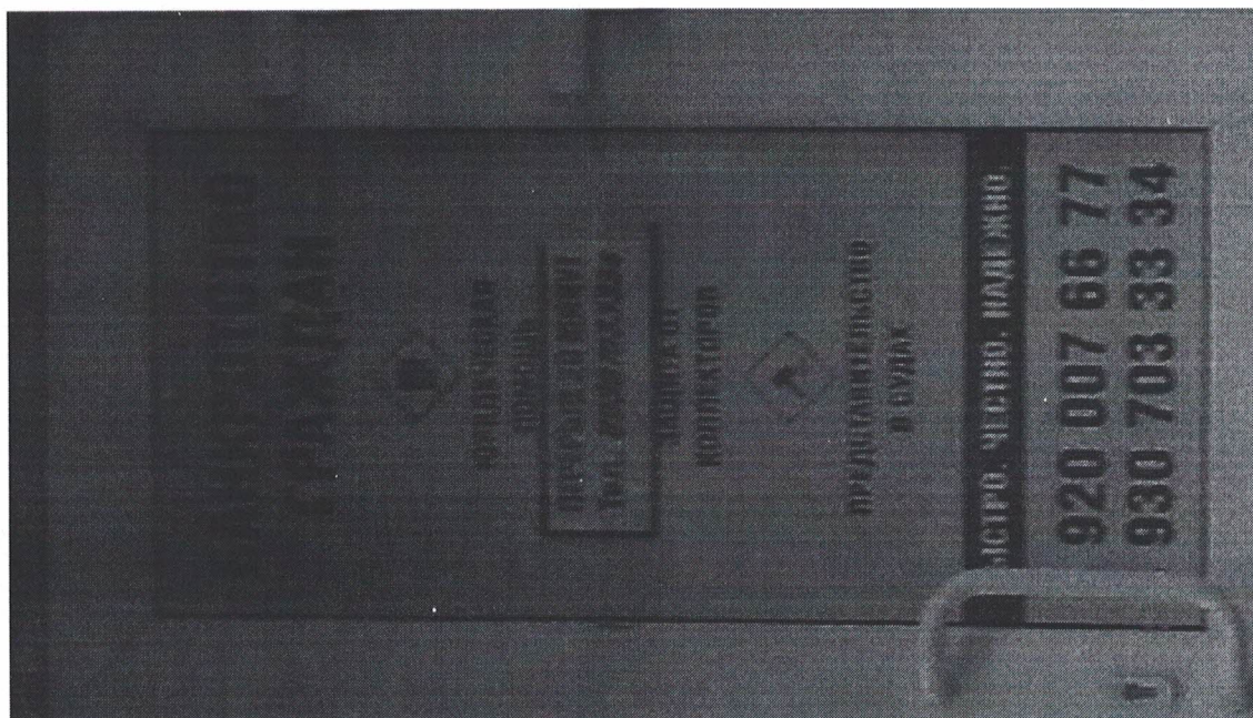
Фото № 2: Эскизное изображение рекламной конструкции