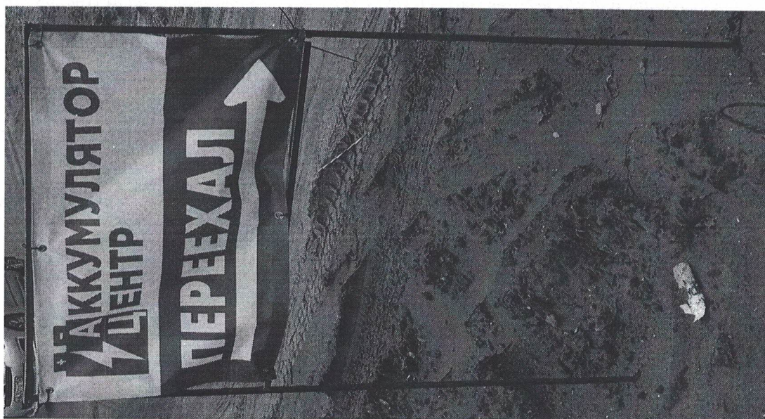
Фото № 2: Эскизное изображение рекламной конструкции