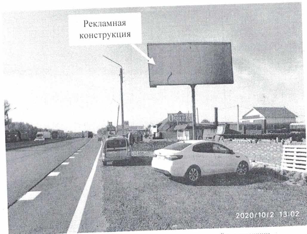
Фото № 1: Панорамный вид размещения рекламной конструкции.

Фотофиксация рекламной конструкции без эскизного изображения, расположенной по адресу: Федеральная дорога М7, 393 км + 820 м (левая сторона).