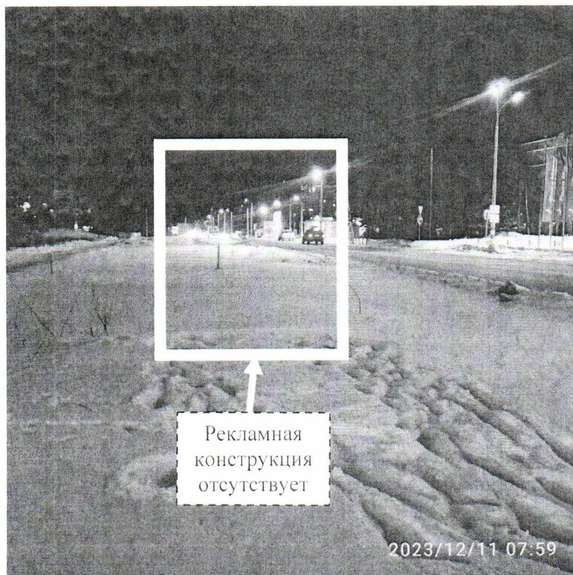
Фото № 2: пр. Свердлова, в районе д. 62Д – после проведения работ по демонтажу.