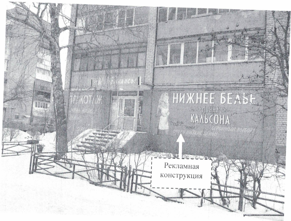
Фото № 1: Панорамный вид размещения рекламной конструкции

Фотофиксация рекламной конструкции размером 3,0 м х 5,0 м с эскизным изображением «Нижнее белье Донна Кальсона Огромный выбор Очень низкие цены», расположенной по адресу: г.Дзержинск, пр-т Циолковского, д. 81.