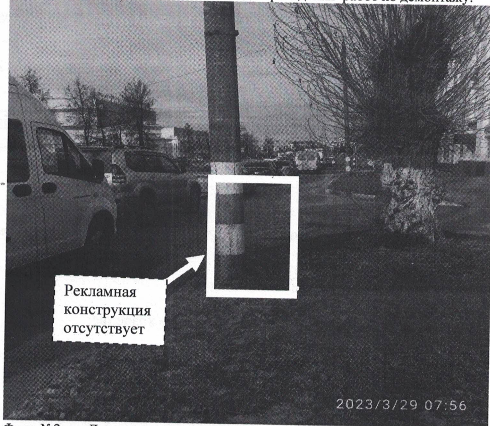
Фото №2: пр.Ленина в районе д.67 – после проведения работ по демонтажу.