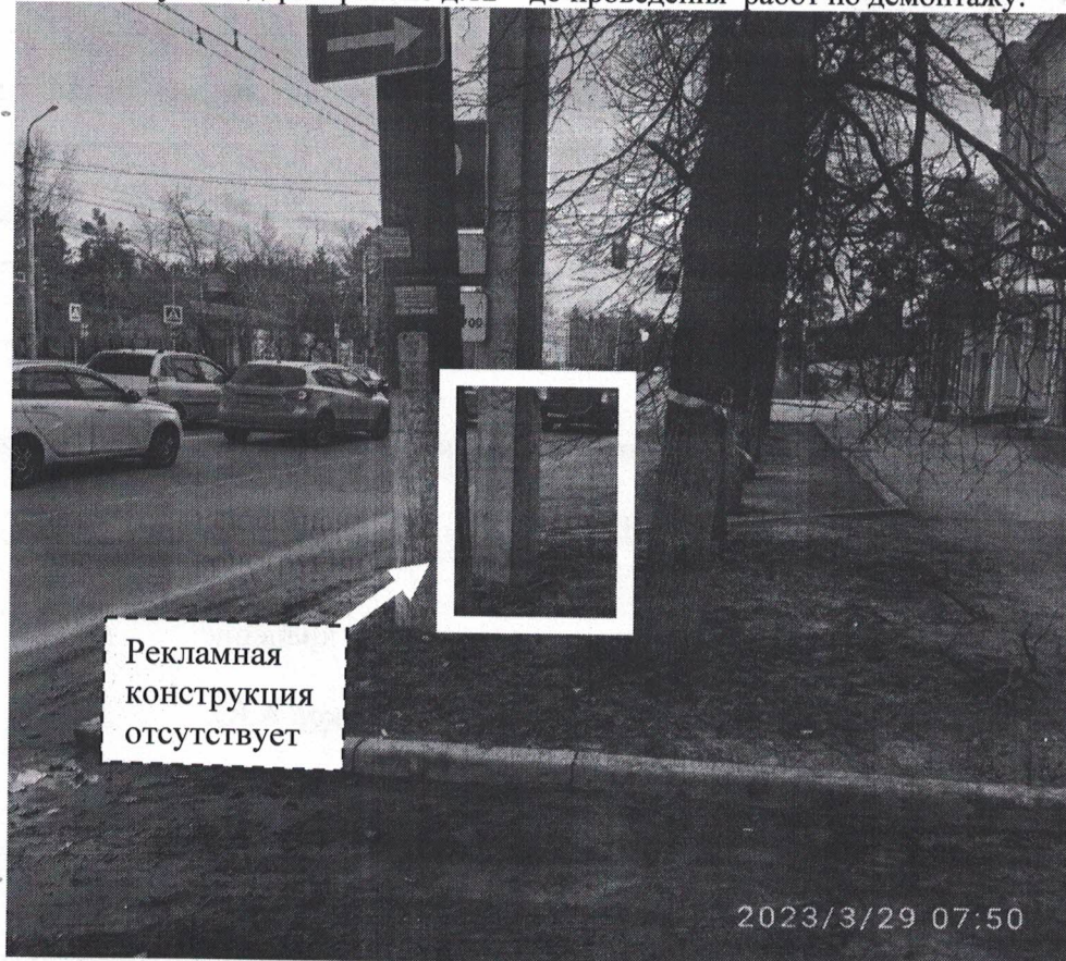
Фото №1: ул.Гайдара в районе д.12 – до проведения работ по демонтажу.