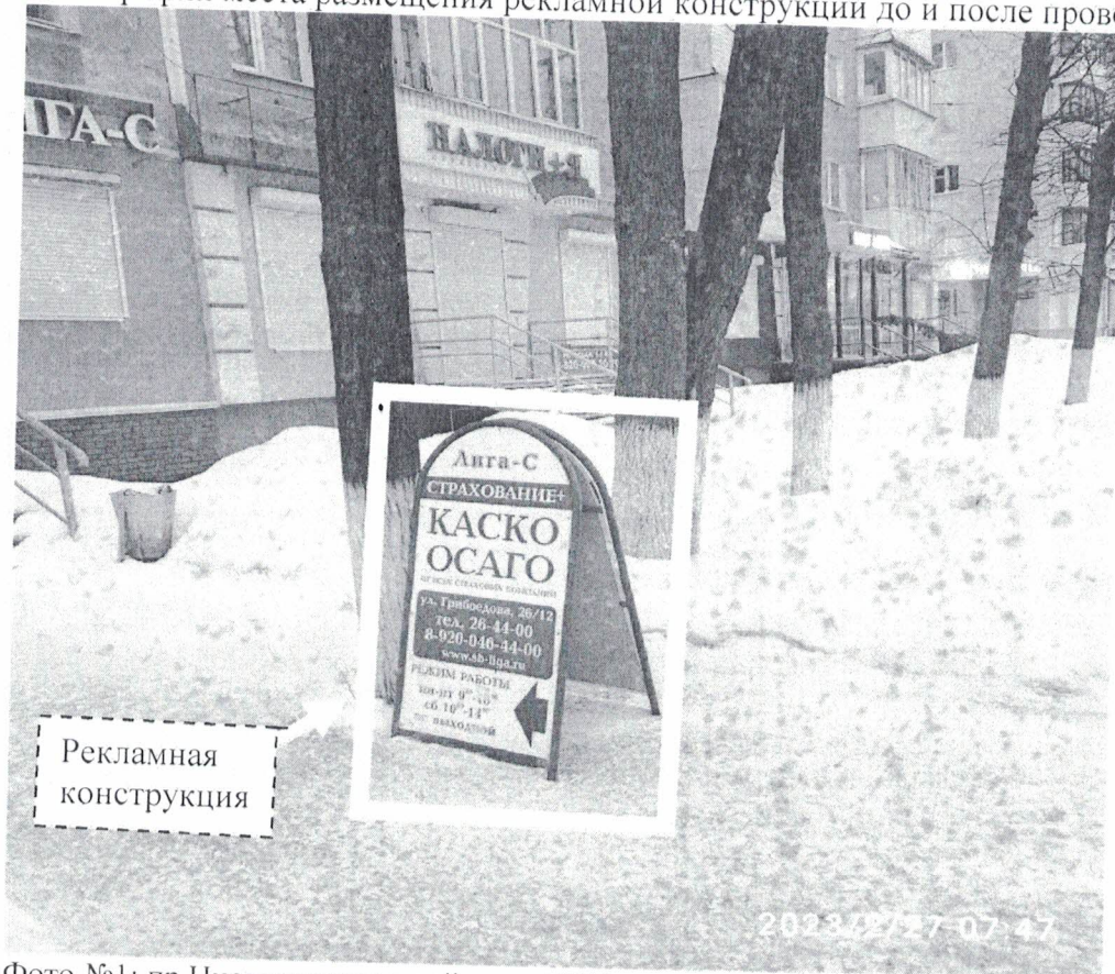
Фото №1: пр.Циолковского в районе д.12/26 – до проведения работ по демонтажу.