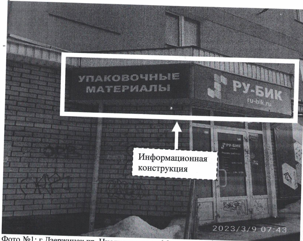
Фото №1: г.Дзержинск пр. Циолковского д.16 – до проведения работ по демонтажу.

Фотографии места размещения информационной конструкции до и после проведения работ